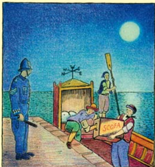
UN PLAN POUR PASSER EN CONTREBANDE LA RECETTE SECRÈTE DU SCOFA EST DÉJOUÉ SUR LA CÔTE ANGLAISE

B eaucoup ont succombé à la tentation. Le scofa, meringue parfumée aux amandes et garnie de crème au beurre, est fabriqué par les sœurs du Carmel