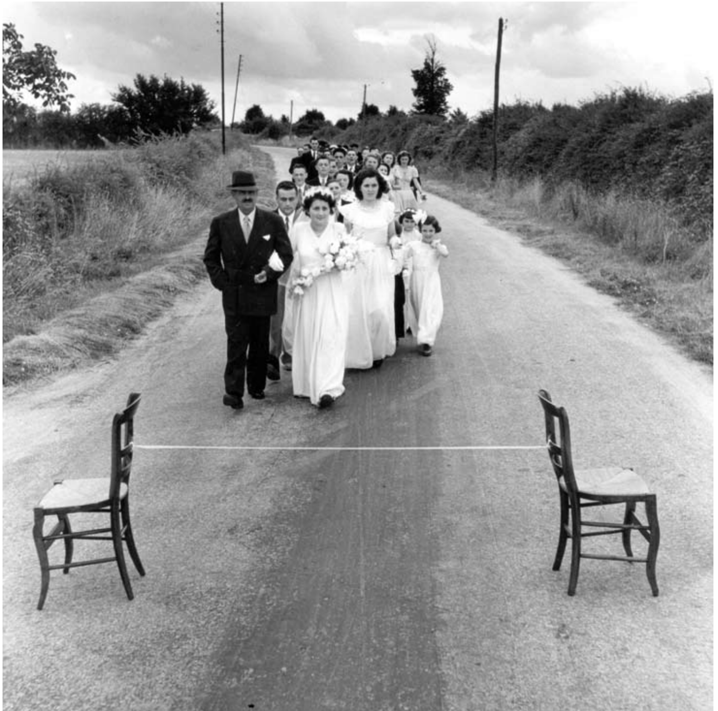
Atelier Robert Doisneau

tographie. Pendant le mariage et les préparations, il allait un peu partout, sans véritablement qu'on sache où, pour prendre ses clichés. Il est monté notamment au grenier. On avait dégagé le grain pour y mettre les tourteaux, les broyés ou les petits gâteaux secs en forme de cœur ou de carré.