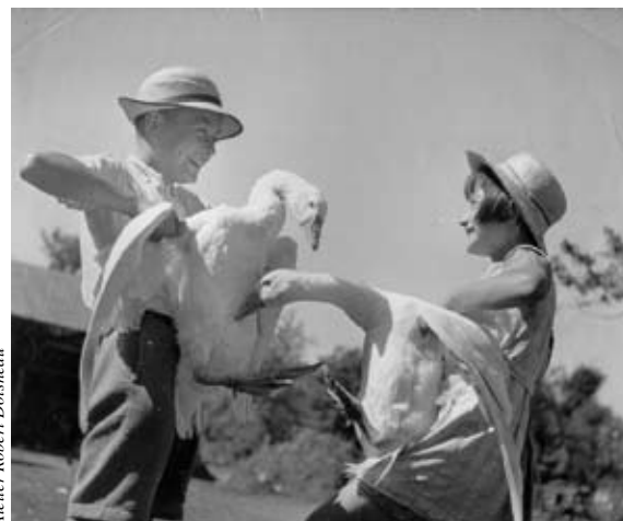
Atelier Robert Doisneau