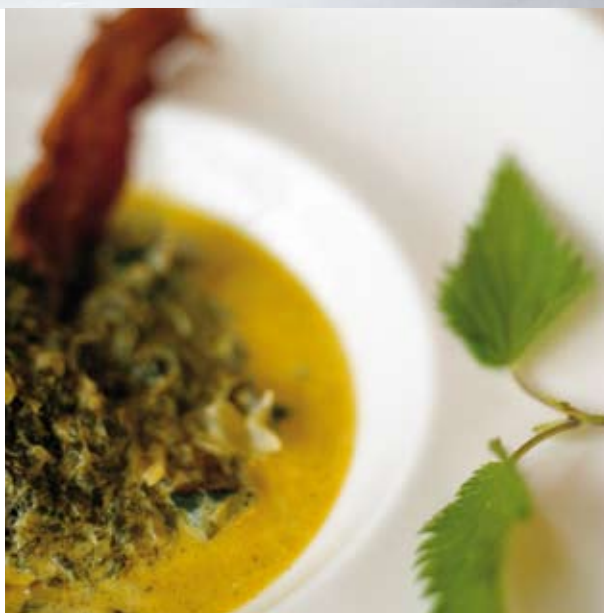
La fressure d'Yves Hénau, au marché Notre-Dame à Poitiers ( L'Actualité n° 84).