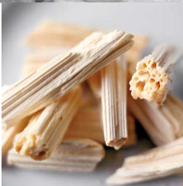
Les cornuelles de Chizé (L'Actualité n° 59).