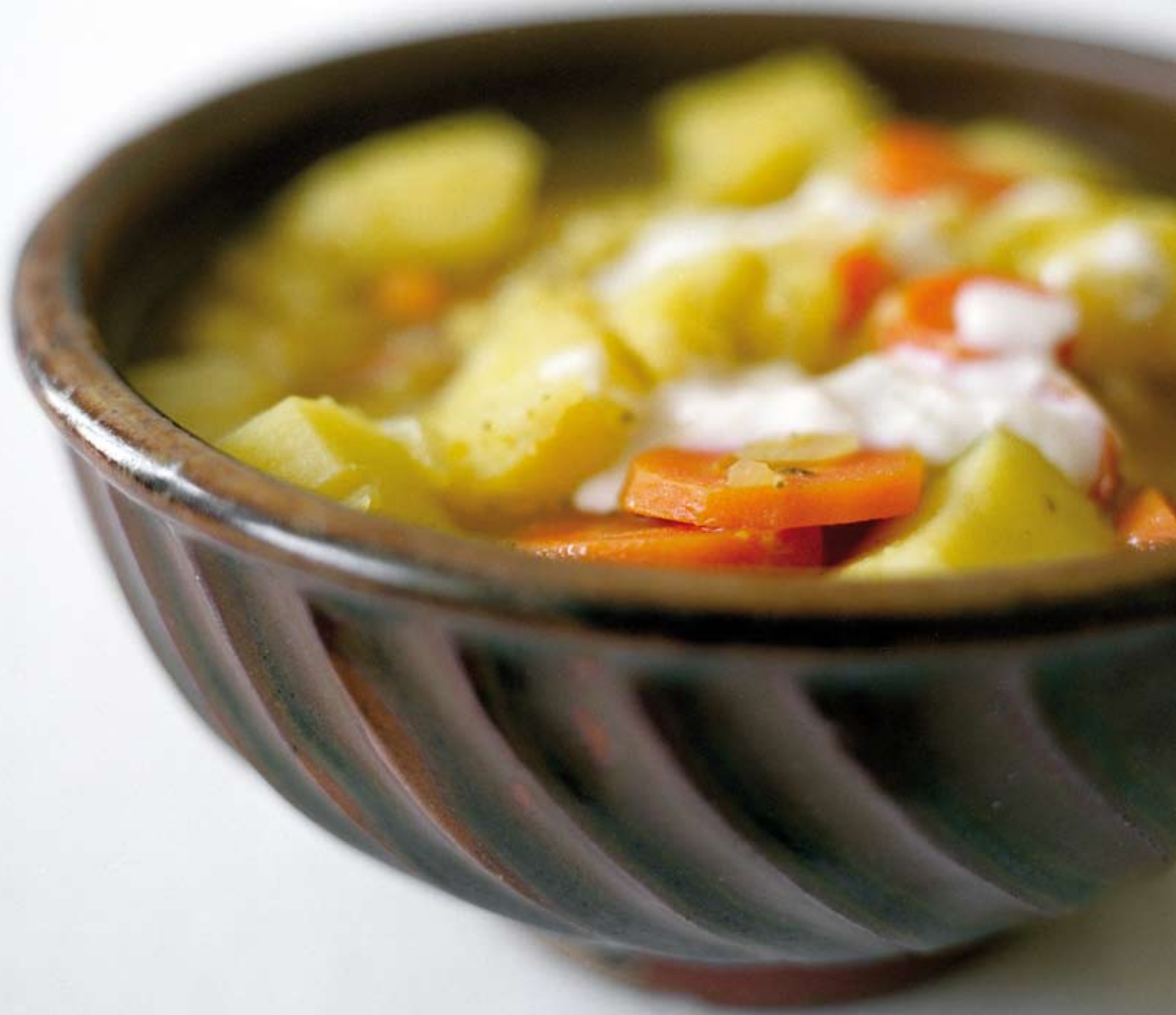
Le fricot ( L'Actualité n° 81).