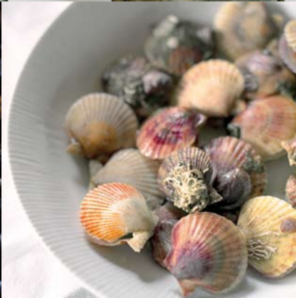
Les lavagnons de l'île d'Oléron (L'Actualité n° 86).