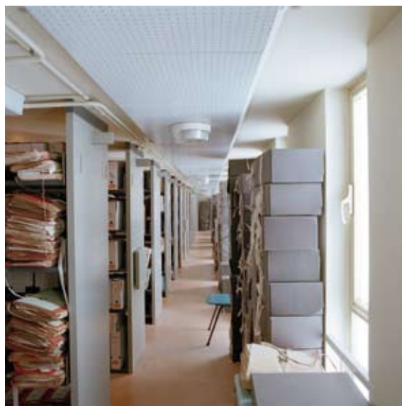
Ci-dessus, les Archives départementales des Deux-Sèvres à Niort. Page de gauche, le dossier de l'affaire Guillot (2U 357), avec une photo de l'assassin réalisée lorsqu'il appartenait au 7 e Régiment de Hussards.

composent un abondant trésor d'informations détaillées, un dédale au travers duquel, pourvu qu'on dispose des outils appropriés, ces existences fantômes d'hommes et de femmes qui ont vécu avant nous peuvent être sauvées de l'oubli. Les historiens, bien sûr, mais aussi, souvent, les auteurs de fiction ont trouvé dans des archives comme celles des Deux-Sèvres une source d'inspiration inestimable ; on sait que Fédor Dostoïevski cherchait dans l'équivalent