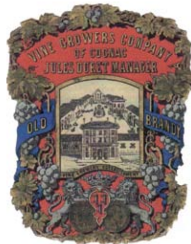
Étiquette du cognac Jules Duret (coll. part.).

Manet et Whistler admirent les peintres japonais et Duret découvre à leurs côtés Hokusai. Déjà le premier a introduit des motifs japonais dans les portraits de Zola et de Duret. En 1871, après l'échec de la Commune, Cernuschi et Duret partent pour un tour du monde. Destination principale : le Japon, qui jusque-là restait fermé. Épris de l'impressionnisme qui point, il met en parallèle l'art japonais empreint des