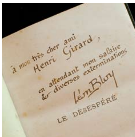
Sur Le Désespéré (1886), envoi de Léon Bloy à Henri Girard, comédien.

médiathèque Michel-Crépeau, un magnifique bâtiment moderne qui fait face aux tours et au port de La Rochelle. L'architecture intérieure suggère l'activité navale qui a fait la célébrité de la ville : salles de lecture agréables, vues splendides, générosité de l'espace dévolu aux collections prêter à la bibliothèque l'atmosphère de l'intérieur d'un bateau et en font un lieu particulièrement propice à l'étude et à la consultation. Et des collections singulières, comme celle de Bollery, paraissent parfaitement à leur place dans cet endroit intime.