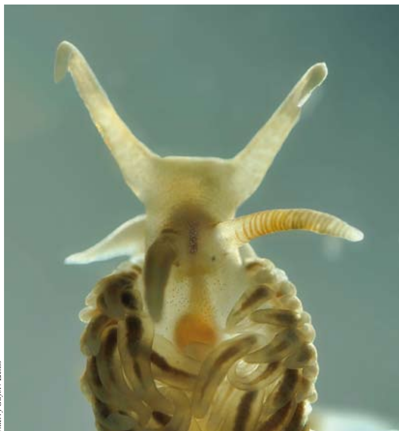
Thierry Guyot / Liens