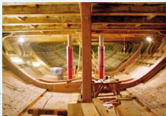
Dans la cale de l' Hermione .