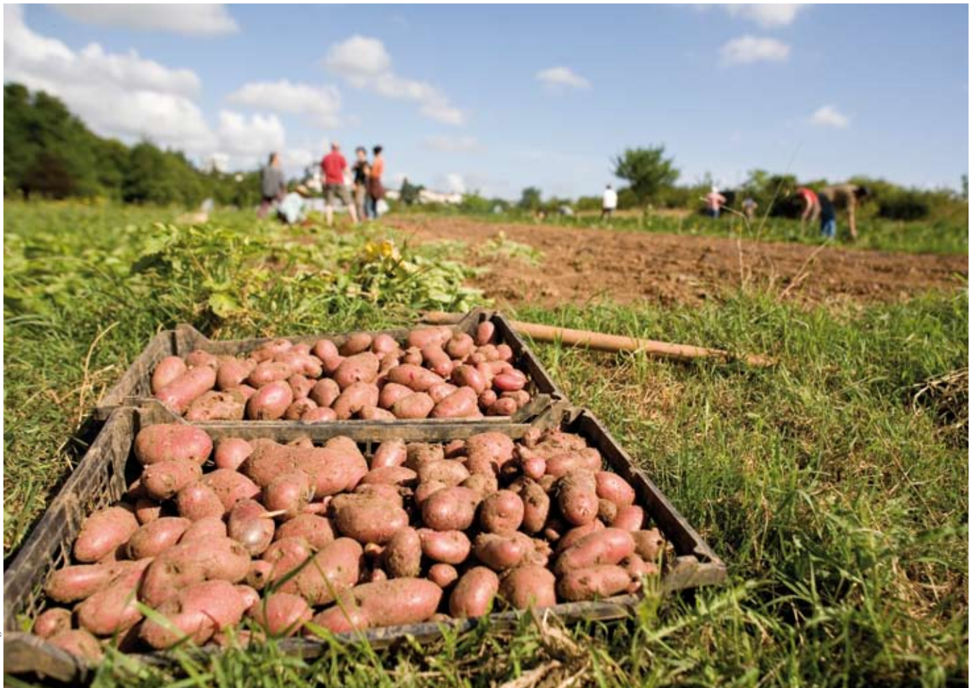
Jardinature à Poitiers