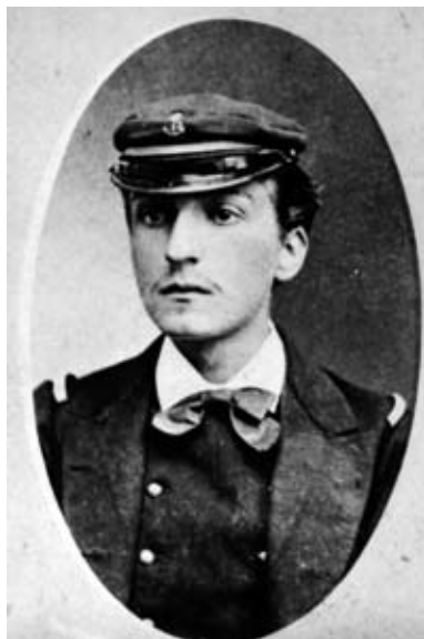
Julien Viaud au temps de son séjour sur l'île de Pâques, 1872.

Pierre Loti est né – presque par hasard – des pages du Journal qu'il a tenu à Constantinople et qui donnèrent naissance à Aziyadé (1879). Les livres qui suivirent furent directement tirés du Journal (les récits de voyage, notamment), soit composés à partir de lui. Certains de