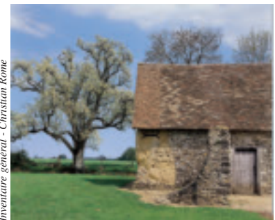
Inventaire général - Christian Rome