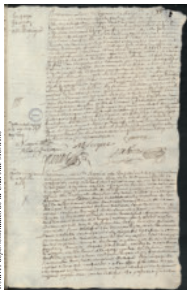
Archives départementales de la Charente-Maritime