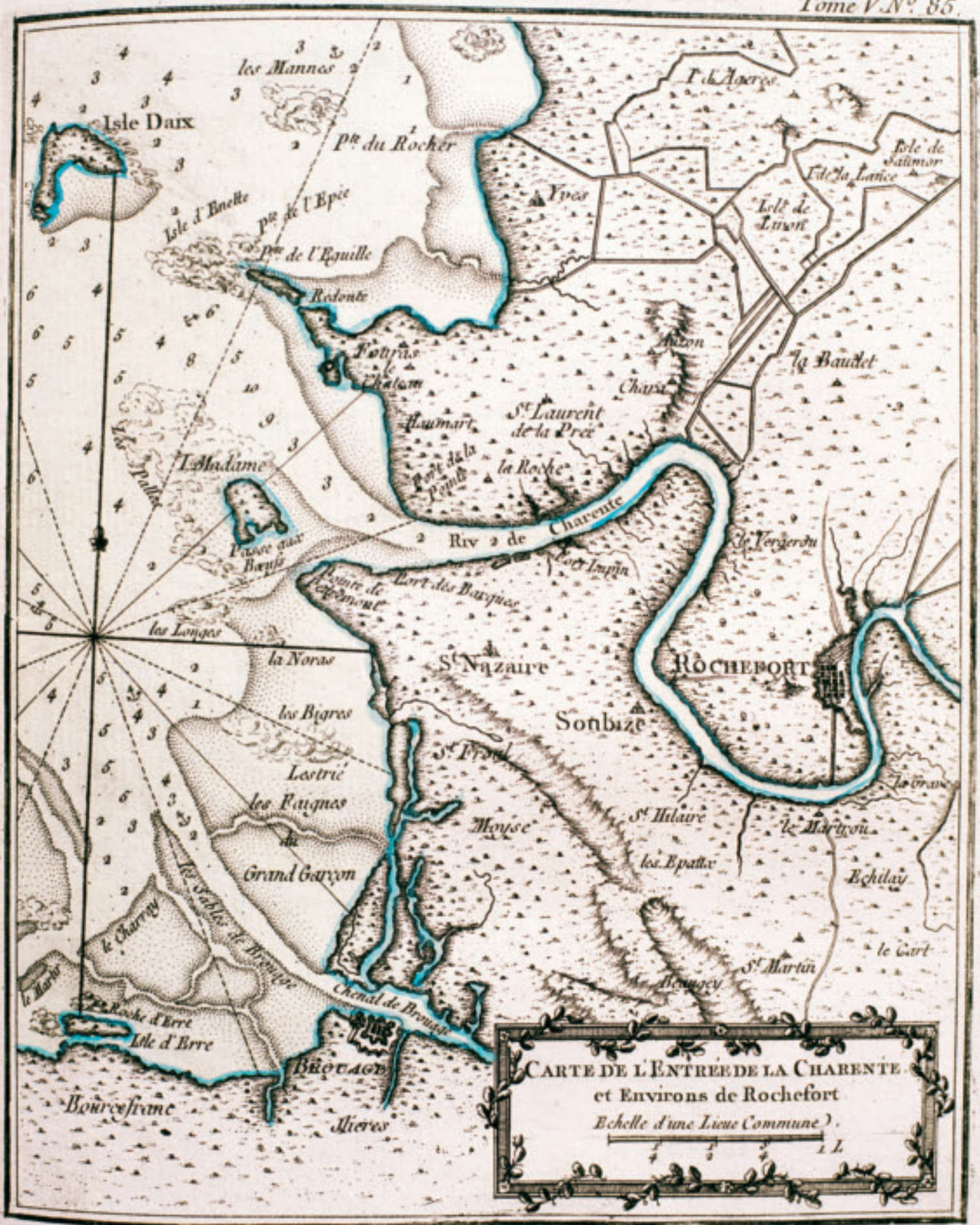
CARTE DE L'ENTREE DE LA CHARENTE et Environs de Rochefort Echelle d'une Lieue Commune 1 L.