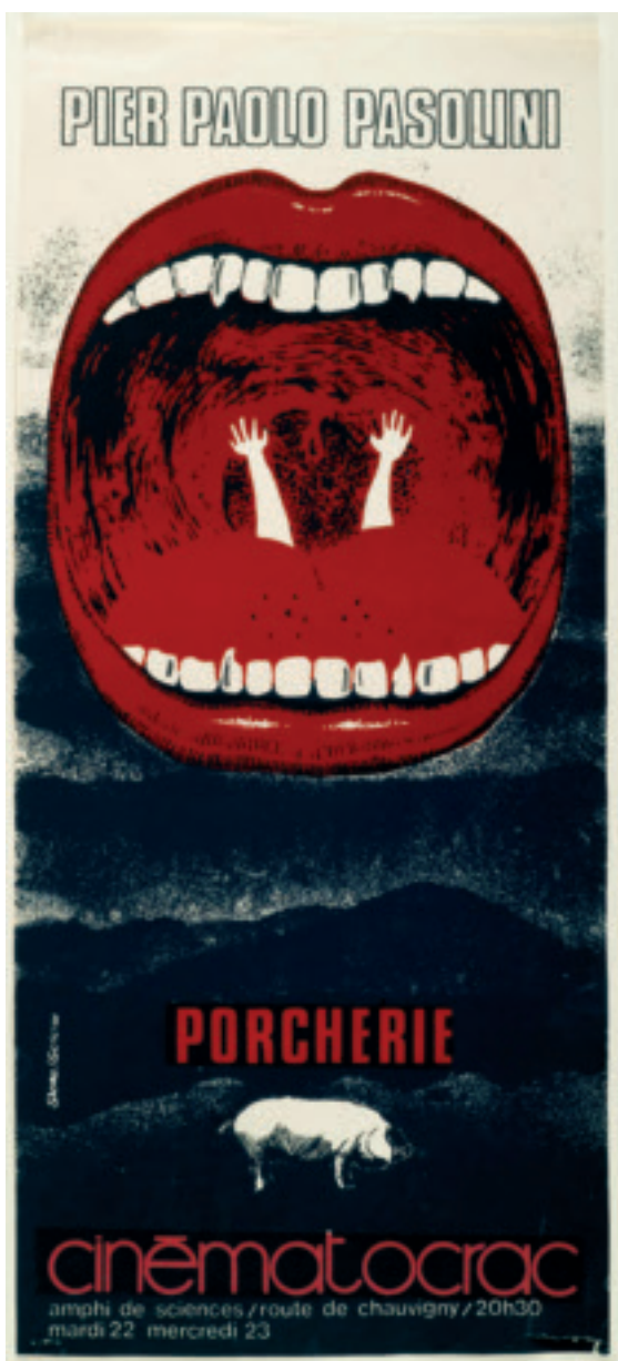
Christian Vignaud - Musées de Poitiers