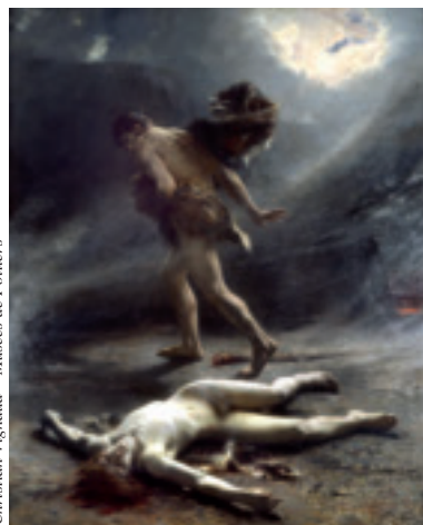
Christian Vignaud – Musées de Poitiers

le nouvel hôtel de ville, elle fait appel à des artistes célèbres parmi lesquels Puvis de Chavannes et Léon Perrault qui peindra la salle des mariages entre 1882 et 1884. Après sa mort, un hommage officiel lui est rendu : le Monument à Léon Perrault , de Raymond Sudre, est inauguré en 1910 dans le parc de Blossac. Route de la Cassette à Poitiers, une plaque commémorative signale la maison de Léon