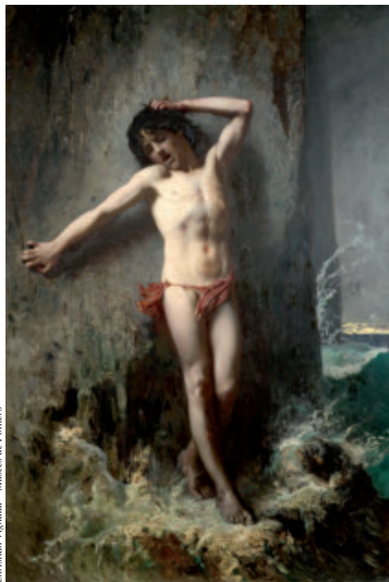
Christian Vignaud – Musées de Poitiers

Jeune baigneur surpris par la marée ou Le petit naufragé (1874), don du peintre au musée de Poitiers en 1887.