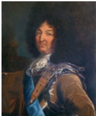
Portrait de Louis XIV, anonyme, fin XVII e -début XVIII e siècle. Collection municipale Saint-Martin-de-Ré, déposée à l'Hôpital Saint-Louis, Saint-Martin-de-Ré.

souveraineté et d'accroître son prestige. Déjà, au début du XVII e siècle, Louis XIII et Richelieu avaient fait construire deux édifices défensifs – un fort à La Flotte et