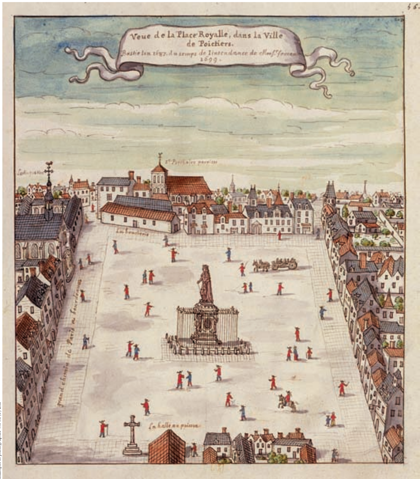
Estampes et photographie VA-86 (3) BnF

Dessin de Boudan levé en 1699 pour la collection Roger de Gaignières.