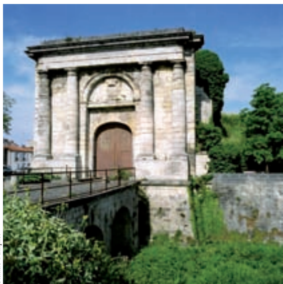
La Porte royale à La Rochelle.