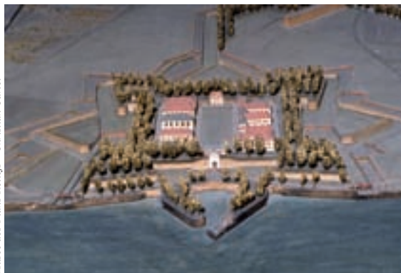
Musée des Plans-Reliefs - Christian Carlet