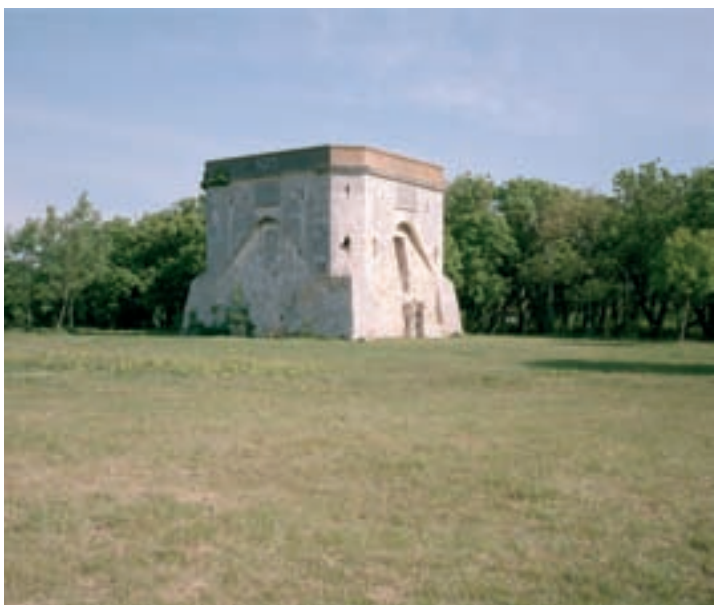
La redoute de Chef-de-Baie.

La batterie de Sablanceaux, aménagée en 1701, constitue un simple épaulement en terre revêtu de gazon. Permettant de disposer 12 canons, elle est néanmoins dé-