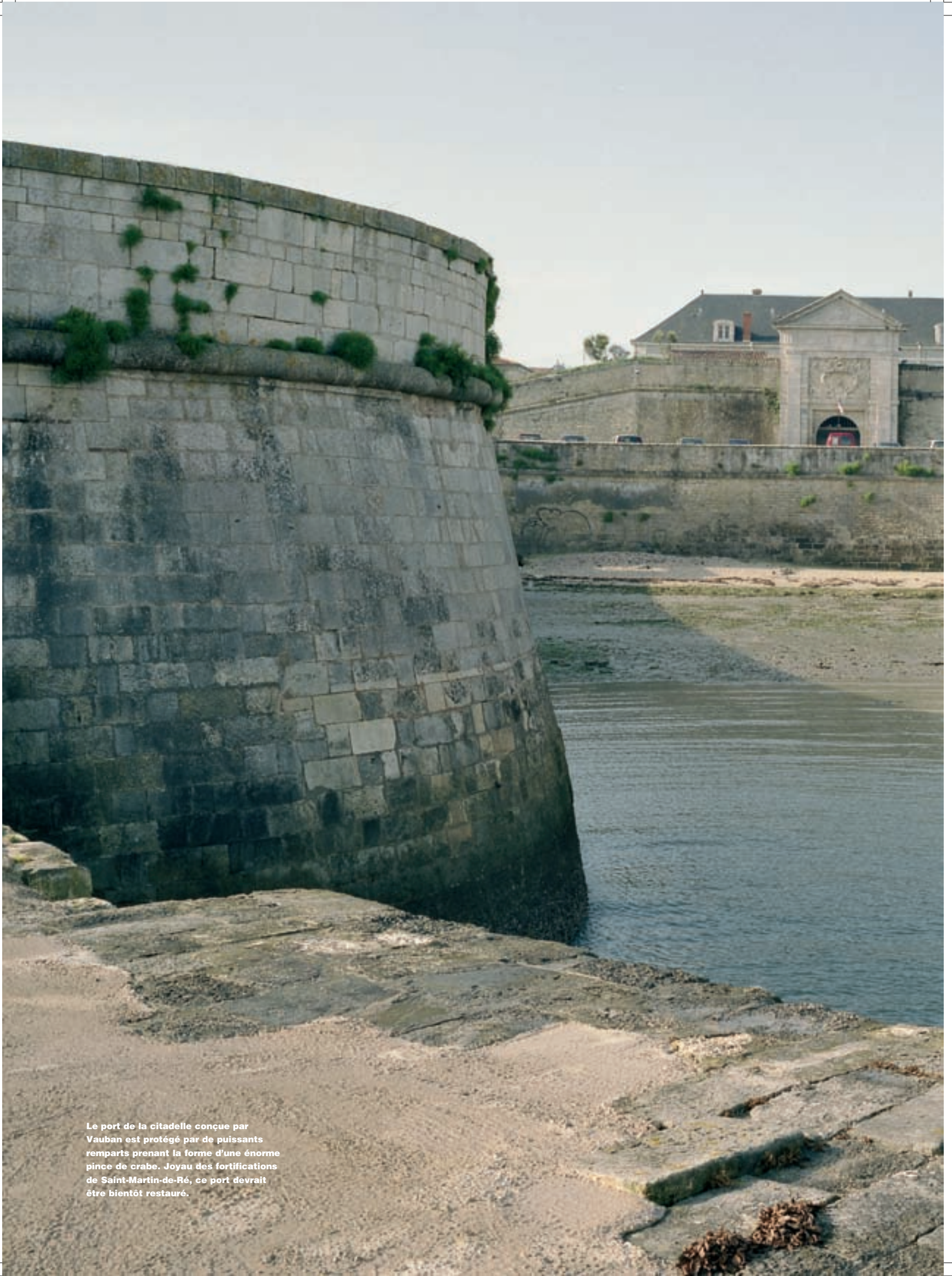
Le port de la citadelle conçue par Vauban est protégé par de puissants remparts prenant la forme d'une énorme pince de crabe. Joyau des fortifications de Saint-Martin-de-Ré, ce port devrait être bientôt restauré.