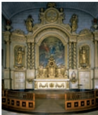
L'ancien retable des clarisses

Le hameau du Marousse à Saint-Christophe comprend un manoir qui pourrait dater du XVI e siècle, mais aussi un grand nombre de bâtiments anciens, dont deux portent les dates 1602 et 1637. Dans la même vallée, une maison de la Borderie à Montrollet porte elle aussi la date 1637 gravée sur le linteau de la porte d'entrée. Mais l'élément le plus remarquable est la forge construite dans les années 1660 dans le hameau du Breuil, également sur la commune de Montrollet. La date 1661 figure sur le linteau de la porte d'entrée et celle de 1669 sur la cheminée du logement situé à l'étage. La particularité de la