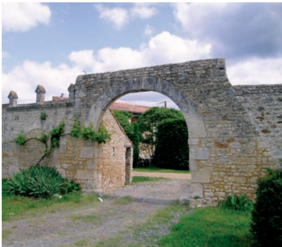
Le portail de la Grand Cour de Charassé, à Montamisé.

Trois exemples sont représentatifs de ces caractéristiques générales. A Vouneuil-sous-Biard, le logis de Bernagout a été édifié au XVII e siècle, comme le laissent voir la forme des lucarnes, le décor et la présence de baies