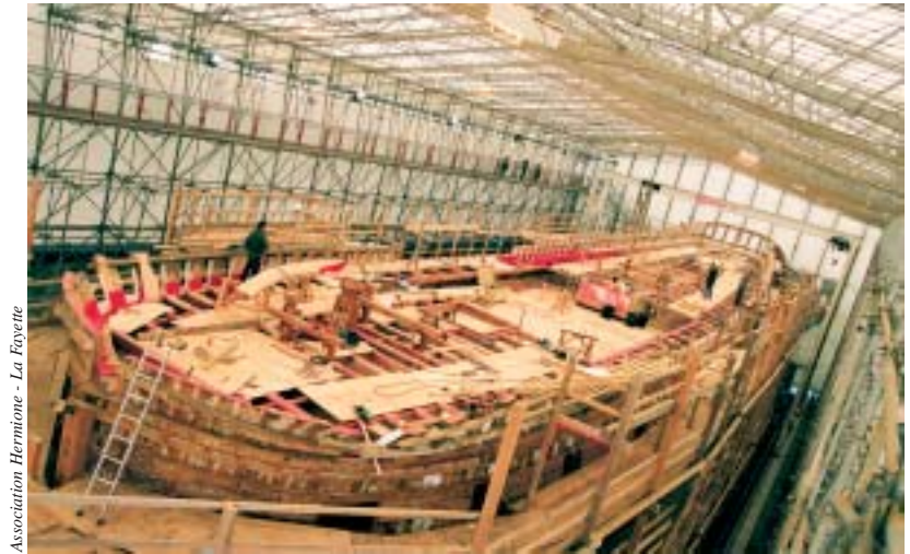
Association Hermione - La Fayette

E n 1780, la frégate Hermione permit à La Fayette de rejoindre les insurgés américains en lutte pour leur indépendance. Ce navire est en reconstruction dans une forme de radoub de Rochefort, située à deux pas de la Corderie royale et du jardin des Retours. Depuis 1997, le chantier est ouvert au public. Des passerelles aménagées offrent différents points de vue sur ce grand navire en bois. Et pour ceux qui voudront en savoir plus sur l'histoire de la prestigieuse frégate, il y a le beau livre d'Emmanuel de Fontainieu : L'Hermione, de Rochefort à la gloire américaine (éd. de Monza, 2002). www.hermione.com