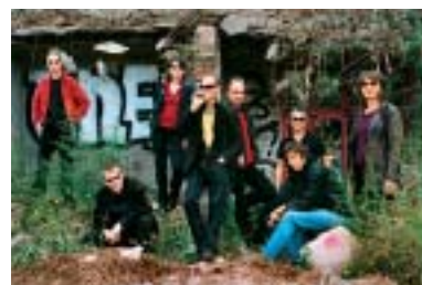
Les Têtes raides

Autour d'une ferme charentaise, au cœur du théâtre gallo-romain ou encore en tracteur, les Sarabandes combinent depuis sept ans une atmosphère proche et amicale à une programmation solide. Avec, cette année, pour les plus connus : Les Têtes raides, Mickey 3D, les Wriggles, Lofofora, Sinsémilia... Aux Bouchauds à Saint-Cybardeaux jusqu'au 2 juillet. 05 45 96 80 38 http://lapalene.unireseau.com