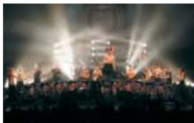
Les Tambours du Bronx

Ouverture et clôture avec la musique d'Armando Ghidoni du 8 au 16 juillet à Lencloître dans la Vienne. 05 49 90 55 46