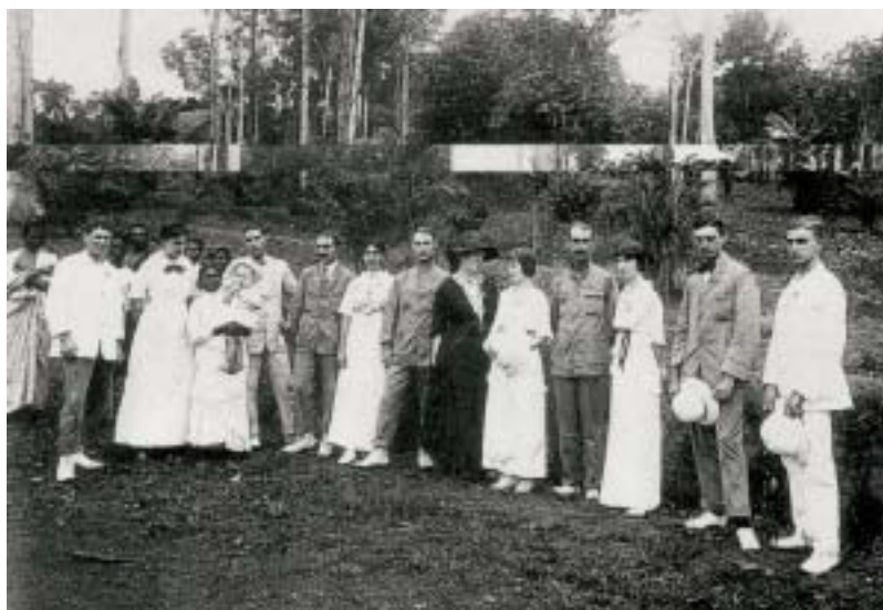
Départ pour la Première Guerre mondiale des Français de Rantau Panjang, 15 août 1914.