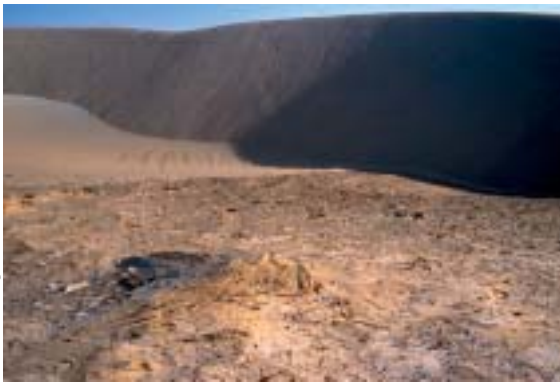
Désert du Djourab (Tchad). Dune fossile (7 Ma) au premier plan et dunes actuelles au second plan. La direction du vent n'a pas changé : les dunes ont la même orientation.