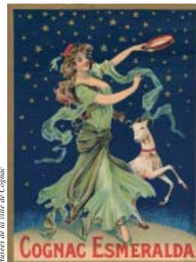
Musées de la ville de Cognac

Cognac Foucauld-Lechantre- Esmeralda. Vers 1900.