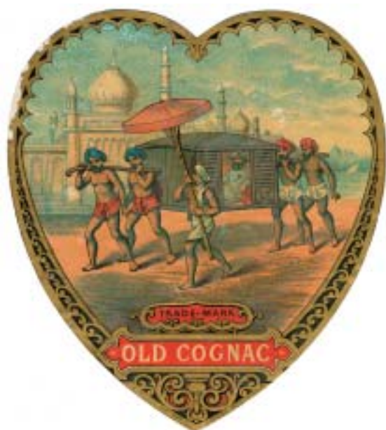
Musées de la ville de Cognac

Old cognac. E. Pichot, Paris. Entre 1875 et 1894.