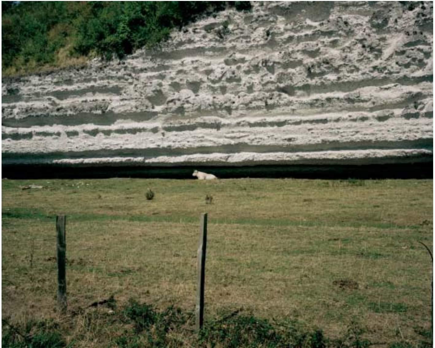
Falaise de Mortagne-sur- Gironde.

riode flamboyante de l'estuaire, quand il a commencé à être utilisé pour une activité commerciale : transport du sel, de l'étain, du vin, etc. C'est de là qu'est venue sa richesse. A présent les communes désiraient redonner vie à ces ports.