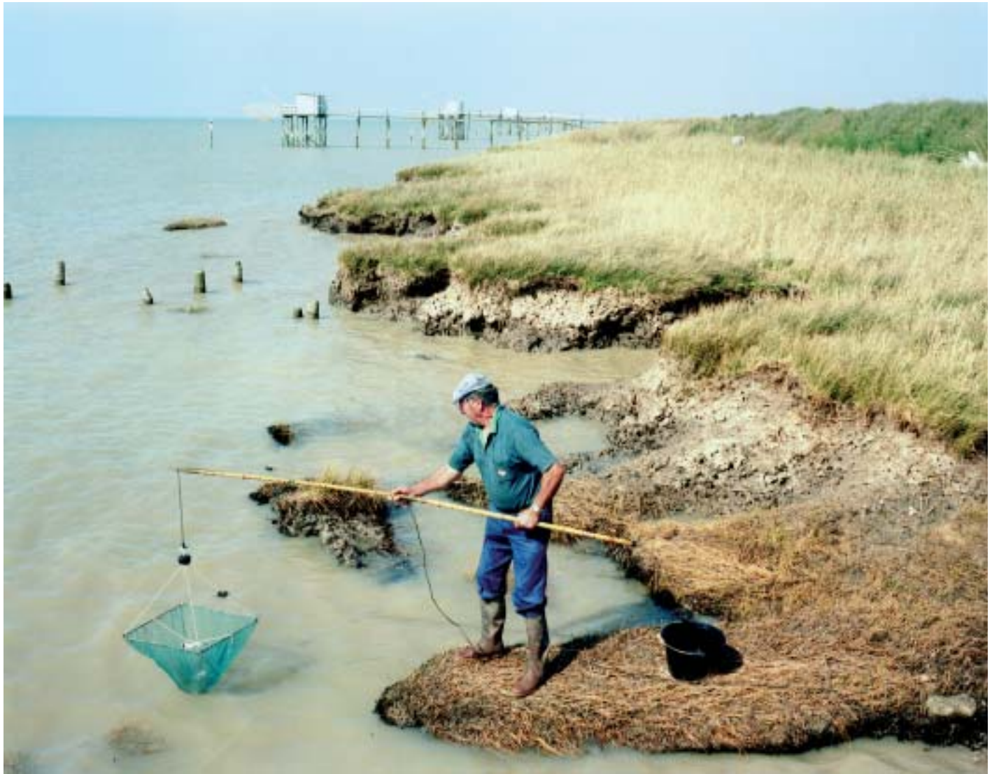
Pêcheur à Vitrezay.

faire un élément de projet, à partir des questions suivantes : qu'est-ce qui caractérise notre paysage, comment évolue-t-il, comment souhaiterait-on qu'il évolue ? Cela suppose une approche de l'aménagement du territoire par l'angle qualitatif.