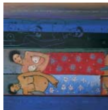
Non, c'est pas vrai, Cheikhou Bâ

A Châtelleraut, le «fantôme du Chat noir» s'est glissé dans le jardin du musée Sully. Hommage de Jean-Charles Blais au Chat noir, célèbre cabaret parisien fondé par Rodolphe Salis (né à Châtelleraut en 1851, mort à Naintré en 1897). L'artiste s'est inspiré d'une figurine du théâtre d'ombres d'Henri Rivière qu'il compare à «du Walt Disney avant l'heure». «En guise de boîte magique, précise-t-il, j'ai placé la sculpture sur un angle de mur, comme une ombre portée, sorte de petite mécanique minimum.» La pièce en acier Korten a été découpée au laser par Brionne industrie à Naintré... 05 49 21 01 27