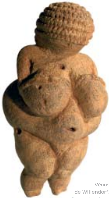
Vénus de Willendorf, Basse-Autriche (28 000 à 21 000 ans)

Le musée Sainte-Croix prête sa collection d'œuvres de Camille Claudel pour une exposition à Québec et Détroit. Il expose, à la place, sept bustes de Rodin : quatre plâtres, un bronze, un marbre et une terre cuite.