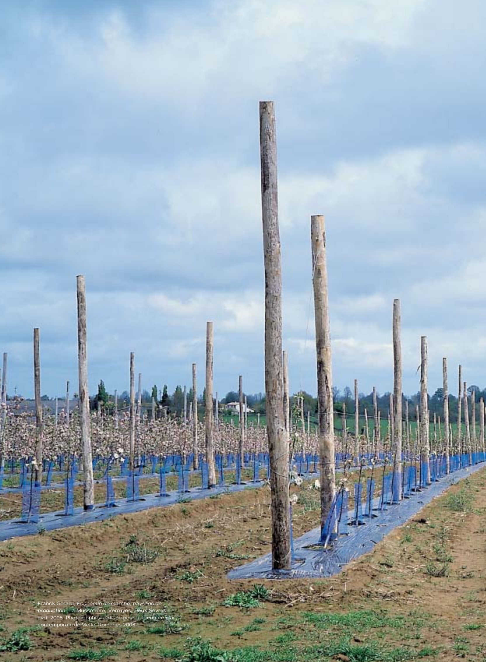
Franck Gérard, Economie de marché, paysage de production ; la Mussotière, Verruyes, Deux-Sèvres, avril 2005. Photographie réalisée pour la biennale d'art contemporain de Melle, Romanes 2005.