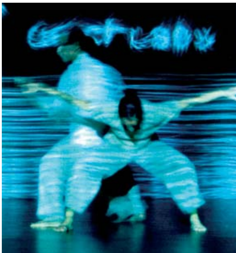
Les mains blêmes

Trois nuits dansantes à l'extrême s'annoncent à Résonances, le festival gratuit de Rochefort : celle des tambours d'Afrique et de la voix noire sera rythmée par les Tambours de Brazza, celle de la salsa et du groove par Bonga. La nuit du Brésil et du concert de feu est entre les mains des Comandos Percu. Du 20 au 22 juillet 05 46 82 15 15