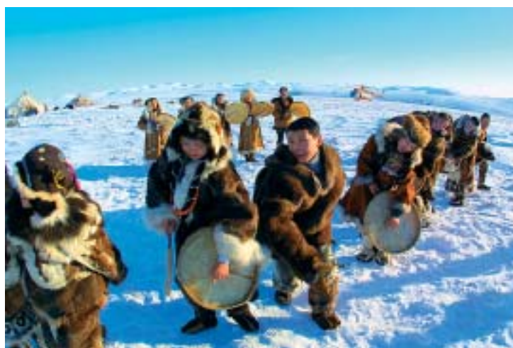
Ensemble de la république Tchoukhtes