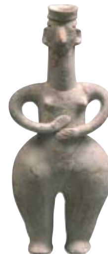
Statuette en terre cuite, Iran (vers 900 av. J.-C.).

Exposition jusqu'au 2 octobre. Tél. 05 49 05 12 13