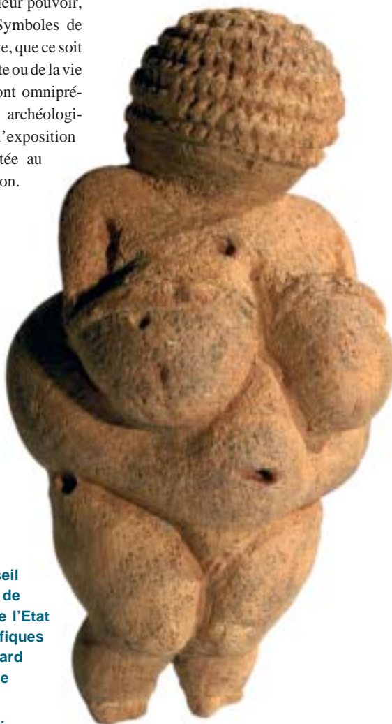
Vénus de Willendorf, Basse-Autriche (28 000 à 21 000 ans).