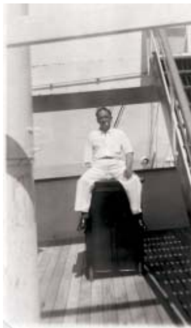
Du 15 janvier au 29 mai, à la Corderie royale de Rochefort, tél. 05 46 87 01 90

Dans le sillage de quelques grands écrivains voyageurs – Joseph Conrad, Robert-Louis Stevenson, Henry de Monfreid – déjà présentés à la Corderie royale de Rochefort, le Centre international de la mer invite le public à accompagner l'écrivain Blaise Cendrars dans ses pérégrinations maritimes et terrestres, à découvrir le personnage, inlassable bourlingueur, et les mille péripéties de sa vie, au travers d'une œuvre abondamment nourrie de ses expériences de voyage, de son regard curieux, lucide et émerveillé, sur le monde et sur les hommes. Dans un décor évoquant l'intérieur et l'extérieur d'un grand navire – selon un parcours ponctué d'extraits de poèmes, de carnets, de livres, d'entretiens radio, de photographies, de documents d'archives et d'objets personnels –, l'exposition «Blaise Cendrars, Escales», réalisée par le Centre international de la mer, propose au visiteur un voyage dans l'univers du poète voyageur.