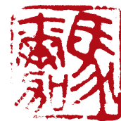
Sceau de Claude Margat qui signifie «cheval».

Encre extraite de son carnet de voyage en Chine.