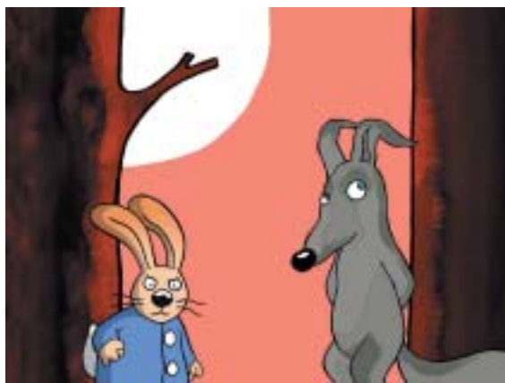
Loulou et autres loups.