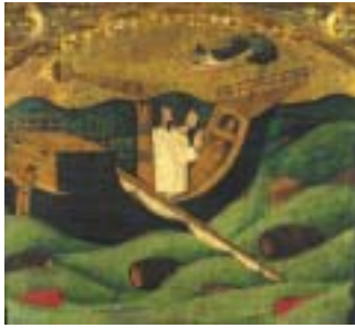
Détail du retable de Saint-Martin (Musée national d'art de Catalogne).

Cosmographie de Münster (1550), coll. Nelson Cazeils.