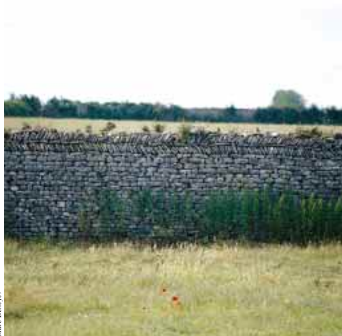
Muret en pierre sèche, élément caractéristique du paysage Mellois.