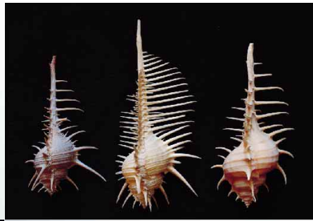
Grandes bécasses épineuses, coquillages du cabinet Lafaille.