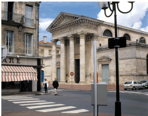
L'église Saint-Louis à Rochefort.

Cette liberté conquise serait pour toi la mer. ■