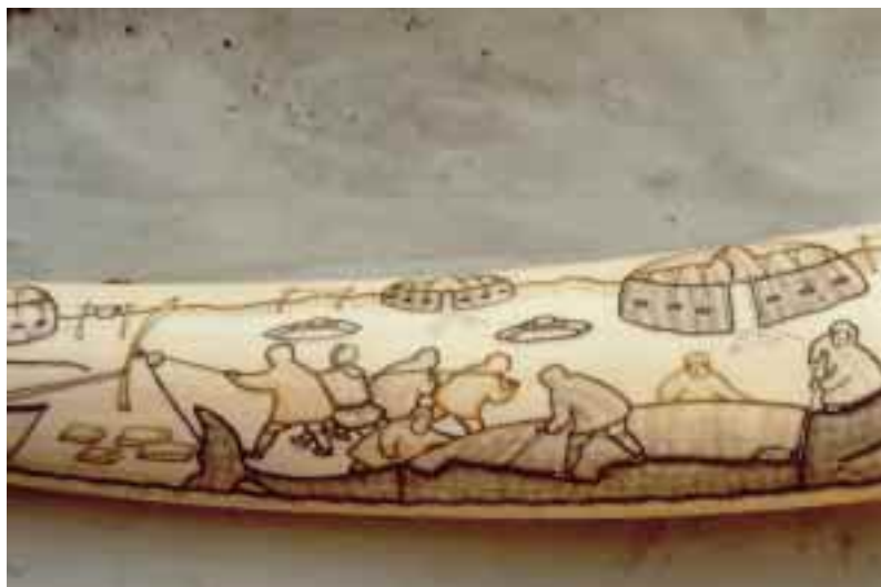
Ivoire de morse gravé, Ouléen, 1990.