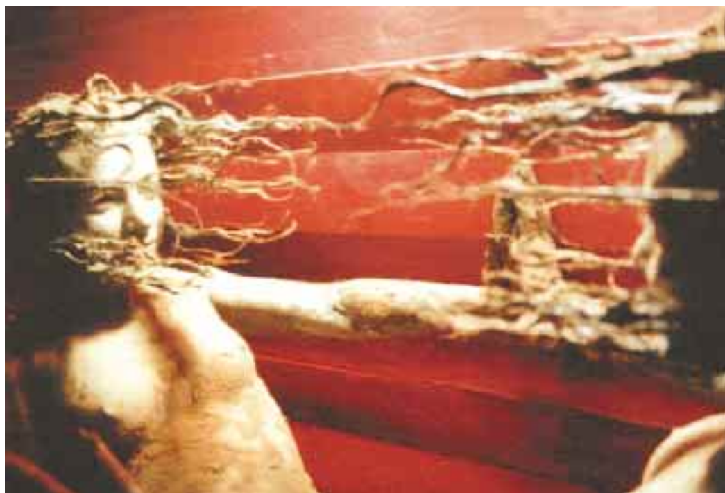
Le Golem à Parthenay le 22 août.

Chaque été, la Médiathèque François-Mitterrand propose de découvrir une partie de ses collections patrimoniales. Cette année, l'exposition entend dresser un panorama des représentations cartographiques du Poitou sous l'Ancien Régime, s'intéressant aussi bien au travail des ingénieurs topographes qu'à celui des graveurs. Du 17 juillet au 15 septembre.