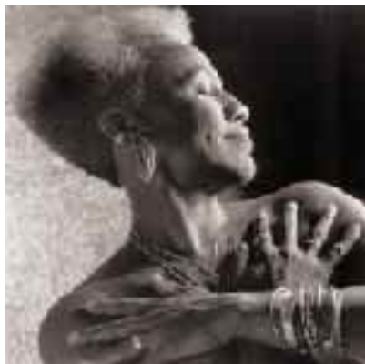
Gaye Adegbalola du 26 au 29 juillet à Cognac.

www.bluespassions.com . Tél. 05 49 32 17 28