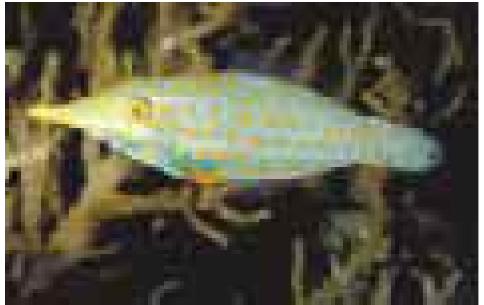
Lime à taches oranges à l'aquarium de La Rochelle.

Une cinquantaine de créations du maître verrier Jean Mauret sont exposées au musée du vitrail de Curzay-sur-Vonne jusqu'en mars 2002. Maquettes, cartons, sculptures, xylographies et vitraux transmettent la philosophie d'un artiste qui, selon ses termes, «ne crée pas véritablement et qui n'a la possibilité que de former, à partir de ce qui existe déjà.» La démarche qu'il a adoptée depuis de nombreuses années aboutit à une œuvre globale en accord avec l'architecture des lieux, créant une harmonie entre l'artiste, la matière, la lumière et le divin. www.museeduvitrail.com Tél. 05 49 53 65 45