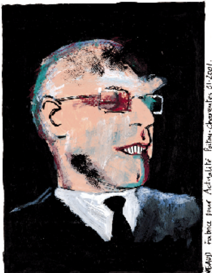
NEAUD Fabrice pour Actualité Poitou-Charentes 01-2001.

Au lendemain de la cérémonie gâchée, je reçus une lettre recommandée de l'administrateur, un savant célèbre : le Collège refusait désormais d'accueillir le congrès en ses murs et de s'associer à lui, puisque monsieur Althusser avait gravement injurié un de ses membres (en réalité, il en avait offensé deux !). M. Althusser était prié de ne jamais plus mettre les pieds en ce lieu ! Il fallut trouver un nouveau site pour le congrès, en l'occurrence l'Institut catholique !