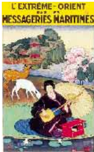
Affiche de Jean Bouchaud, 1930.

Exposition d'affiches «Voyages de rêves, rêves de voyage», au musée national de la marine de Rochefort, Hôtel de Cheusses, jusqu'au 12 juin 2000.