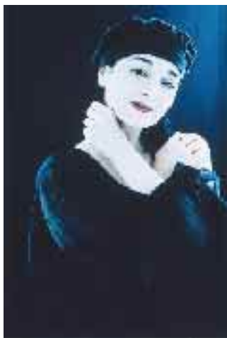
La chanteuse portugaise Mísia le 10 juin au festival de Vivonne.

A Oiron, se déroule la 11 e édition des rencontres régionales des musiciens et danseurs amateurs.