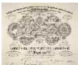
En-tête de Laroche-Joubert, 1869, coll. musée du papier.