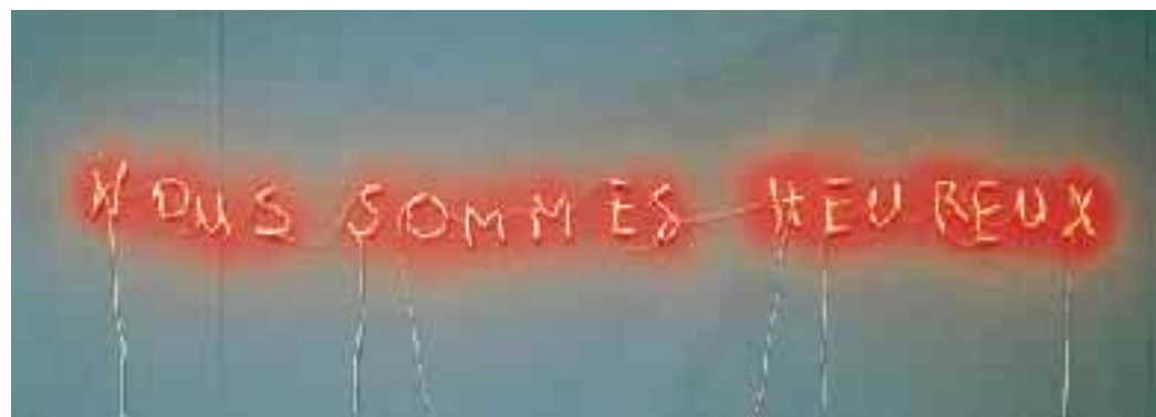
Ci-dessus, œuvre de Claude Lévêque, 320 x 15 cm, coll. Frac Poitou-Charentes.

Musée des Beaux-Arts, Angoulême, jusqu'à la fin août. Tél. 05 45 95 07 69