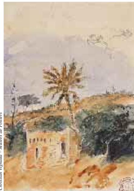
Christian Vignaud - Musées de Poitiers

La médiathèque de La Rochelle expose des fac-similés des carnets jusqu'au 20 août.