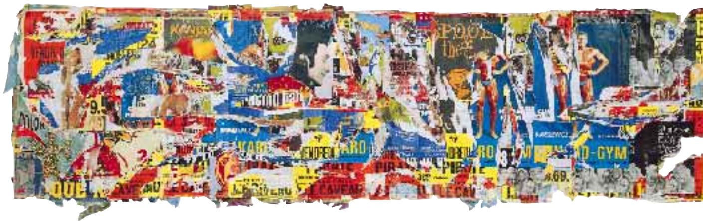
Affiche de Jacques Villeglé. «La Quête du Graal», Avenue de la Libération, Poitiers, juillet 1998, 180 x 587 cm.