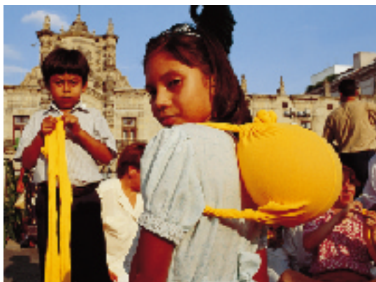
Ci-dessus, des enfants de Guadalajara en train de fabriquer des cauris, sacs à dos réalisés à partir d'une paire de collants.

J'essaie de comprendre quel était l'état du vêtement juste avant l'explosion de la bombe atomique, et aussi comment il a été fait. Si un bouton manque, j'essaie de deviner, en regardant, si ce bouton manquait avant. Je n'ai pas de règle pour cette marge d'interprétation. Chaque cas est unique. Par exemple, il y a une cagoule d'enfant. Tous les enfants avaient une cagoule pour se protéger en cas de bombardement. Visiblement, cette cagoule est recyclée