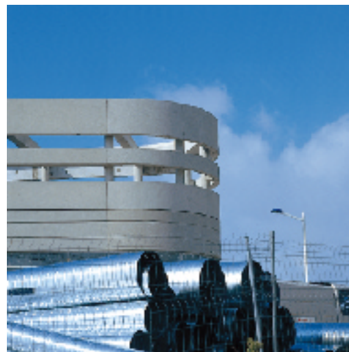
Construction du pôle analytique