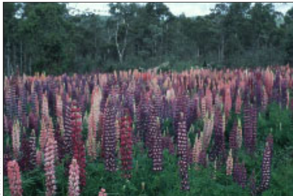
Lupins des Andes en Tasmanie (exemple de «brassage planétaire»).

En fait, l'idée que je me fais de la notion de jardin planétaire doit conduire à la prise de conscience que celui qui produit sans dépenser en énergies contraires réalise par pomme un bénéfice supérieur à celui que réalise le producteur industriel. Le coût global par unité de production industrielle est toujours supérieur au coût artisanal. L'angle de calcul dont je parle n'est pas celui des économistes du capital mais des économistes de l'écologie.