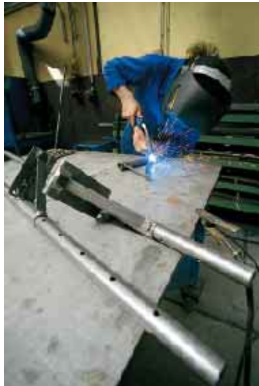
Au lycée Auguste Perret, à Poitiers