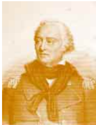
Louis René Le Vassor, comte de La Touche Tréville, commandant de l' Hermione , Archives départementales, La Rochelle.

En quelques siècles, la cartographie marine a beaucoup évolué. « Au XVIII e siècle, les cartes de navigation présentent déjà la même configuration que nos cartes actuelles, explique Arnaud Dautricourt, du Centre international de la mer, à Rochefort. Au système de quadrillage par les rhumbs – un réseau de lignes tracées selon la rose des vents – on commence à superposer la grille des latitudes et des longitudes. Les cartes sont devenues plus précises, notamment au niveau de l'indication des profondeurs et de la nature des fonds, grâce au travail des hydrographes et aux informations recueillies par les navigateurs. » Les cartes viennent à l'appui des observations que le marin réalise «sur le terrain». Pour mesurer la profondeur de l'eau et connaître la nature des fonds, à proximité des côtes, La Touche utilise une ligne de sonde, constituée d'une corde graduée lestée