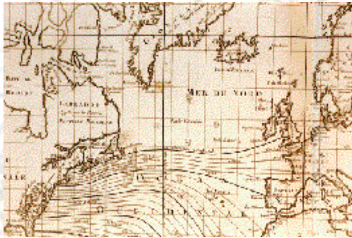
Carte des variations de la boussole et des vents généraux, J-N Bellin, 1765.

Il existe, à l'époque de l' Hermione , un autre instrument, plus élaboré, qui remplit la même fonction. Le «quartier de réduction» réunit, dans un ta-