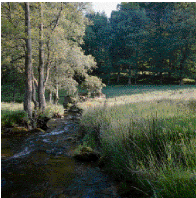
La Vienne, à 6 km de sa source.