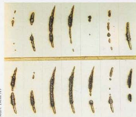
Brûlures solaires de Charles Ross

On y voit aussi un lapin à queue de poisson. Le thème du cabinet de curiosité s'inscrit donc naturellement dans le projet de collection pour Oiron. Il permet également de renouveler les modalités de la commande publique, plus proche ici de