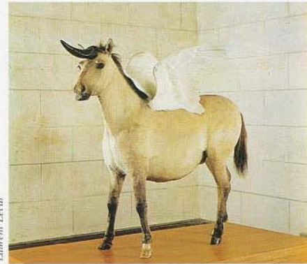
Pégase-Licorne de Thomas Grünfeld

arbres fruitiers exotiques sont peints dans le cabinet des Muses. Dans la chambre du Roi, des chars tirés par des éléphants, des chameaux, des léopards et des chevaux représentent les allégories des quatre continents connus à l'époque.