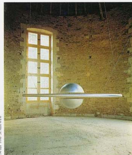
Champs magnétiques de Tom Shannon