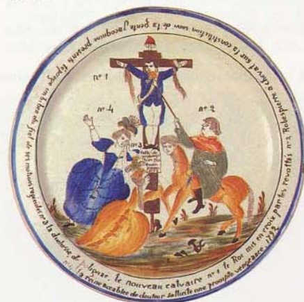
Assiette contre-révolutionnaire, XVIII e siècle, coll. Musée de Poitiers.

Les combattants ne sont pas si éloignés que cela les uns des autres. L'opposition Blancs/Bleus doit encore être nuancée. Hors de la zone insurgée, il y eut des minorités blanches en zone bleue. On perçoit un phénomène de cinquième colonne.