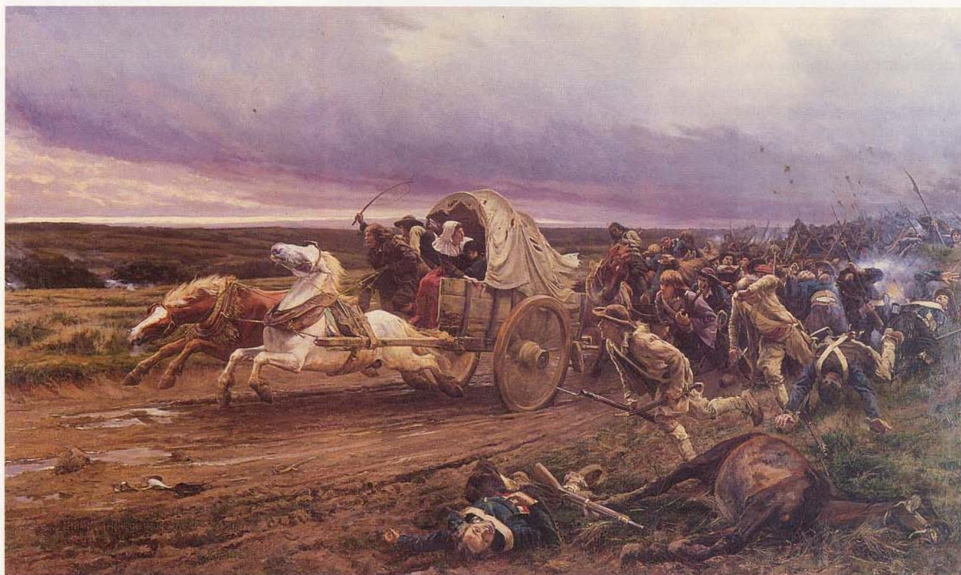
"La déroute de Cholet, octobre 1793", par Jules Girardet, 1883, Musée d'histoire et des guerres de Vendée, Cholet.

Beaucoup de mécontentements se sont accumulés à partir de 1790, notamment les désillusions fiscales, la levée des 300 000 hommes en mai 1793, la constitution civile du clergé, la chasse aux prêtres réfractaires, la vente des biens nationaux. En Vendée, cette accumulation a atteint une masse critique qui a