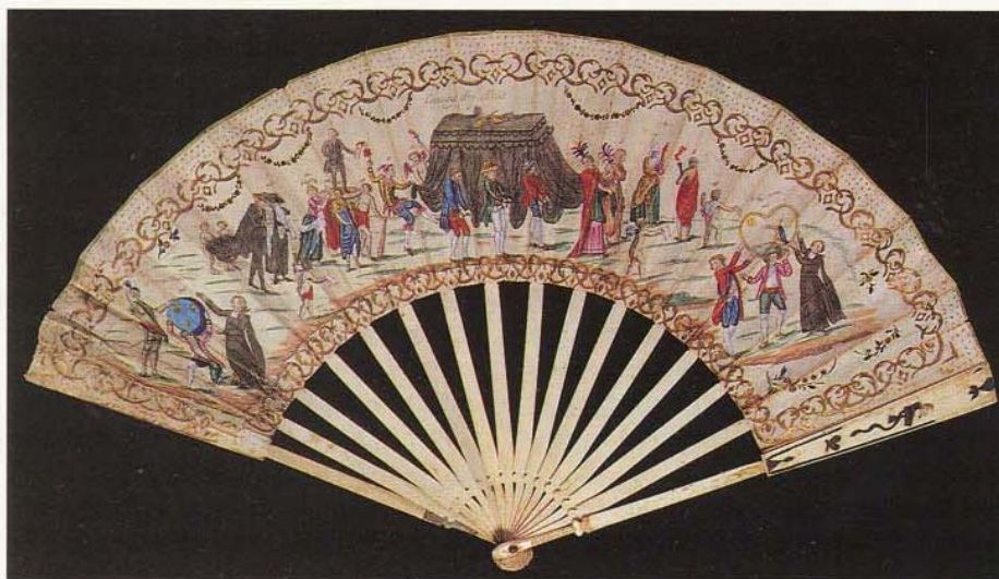
Le "convoy des abus", éventail XVIII e siècle, coll. Musée de Poitiers.

Est-ce tactique ou cela correspond-il à la présence de minorités, voire de majorités bleues qui se sont tués le temps de la domination des Blancs ? Toute réponse doit être nuancée. Il est clair cependant que les hommes de la Terreur, bardés d'une idéologie maximaliste et irréaliste, obsédés par le "grand complot", ont mené une répression féroce en Vendée. Les colonnes infernales ont massacré des civils. De sorte que les indécis, ceux qui aspiraient surtout à vivre en paix après la guerre, sont entrés dans une spirale de haine.